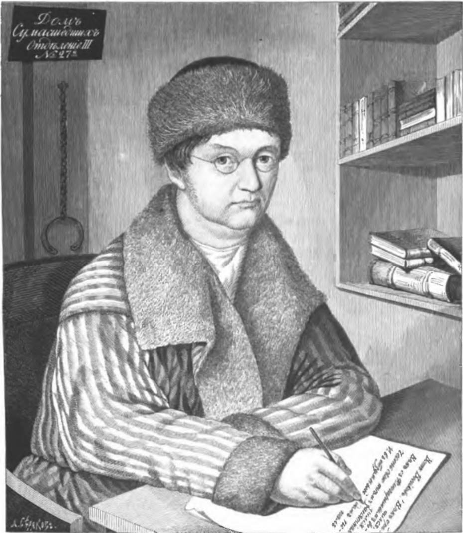
А. Э. ВОЕЙКОВЪ.